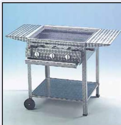
3-pits brander met toebehoren: Mobile sta-voet, zij-werkbladen en geëmailleerde pan