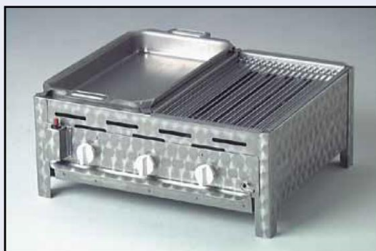
3-Pits brander met toebehorenset Rooster-Pan combinatie