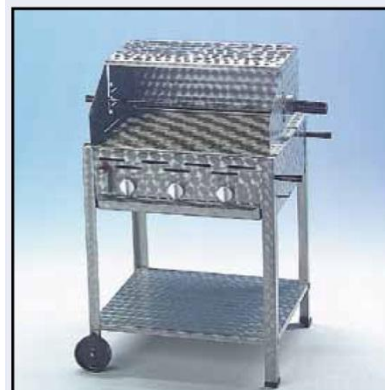
3-pits brander met toebehoren: mobiele sta-voet en grill-opzetstuk.