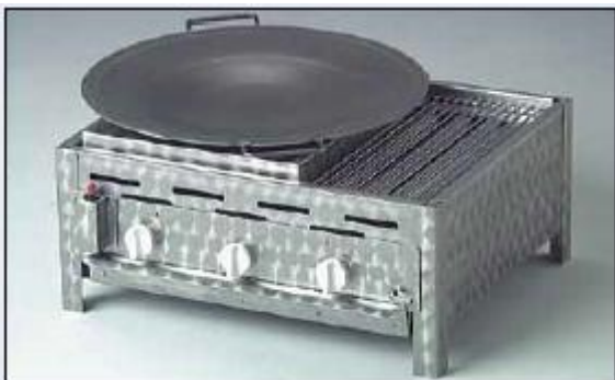
3-Pits brander met toebehorenset Wok-set: Wokpan, Adapter en Rooster (Werkt alleen met Vlamafdekking)