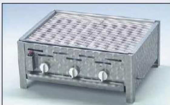
3-Pits brander met toebehorenset rooster, vlamafdekking en vet-opvangbak.